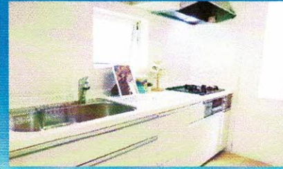
※写真は当社の注文住宅施工事例であり、参考プランとは異なります。 ※家具・外構等は建物本体価格に含まれておりません。