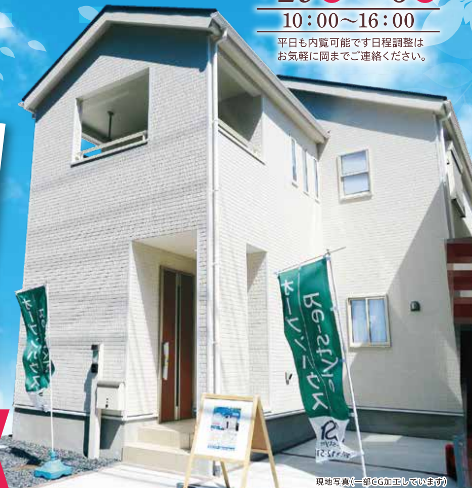
現地写真(一部CG加工しています)